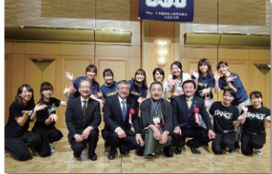
本学ダンスサークルの皆さんと来賓の方々 (情報交換会にて)

平成30年11月24日、25日にサンポートホール高松にて第51回日本臨床衛生検査技師中四国支部医学検査学会が行われました。今回、学会事務局長として運営に携わりました。学会では本学の多くの在校生や卒業生が研究発表という形で参加していただきました。学会の運営という貴重な体験をしたことを糧にして、9年後の香川開催では再び学会に協力ができるように日々精進していきたいと思っております。その時にも多くの本学関係者が参加していただけることを期待しています。