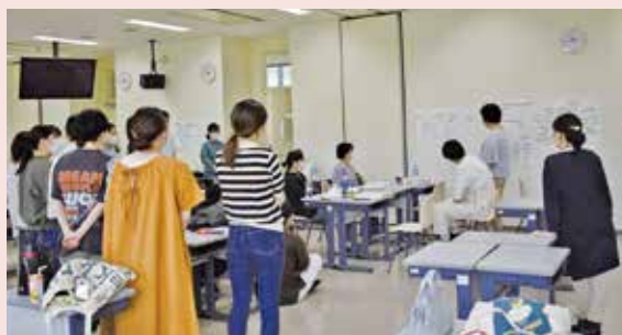
在宅看護学実習(発表)

感染予防対策を徹底しながら精神看護学実習・在宅看護学実習は学内で、成人看護学実習は臨地で行いました。学内実習では各領域で学んだ知識を関連付けながら知識を深め、臨地実習では患者さんとかかわる時間の制限はありましたが、学内で深めた知識を活用し実践力を身につけることができ、貴重な経験になりました。