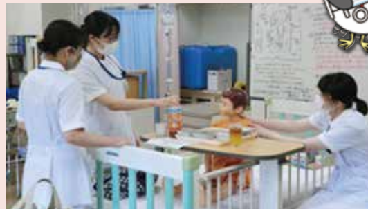
小児看護学実習室でシミュレーション学習をしています。

メンタルヘルス看護論実習では、臨地実習に行き、統合失調症の男性患者を受け持つことができました。治療的コミュニケーション技法を用いて患者と話すことで、信頼関係を構築し、患者の持つその人らしさを見出すことができました。