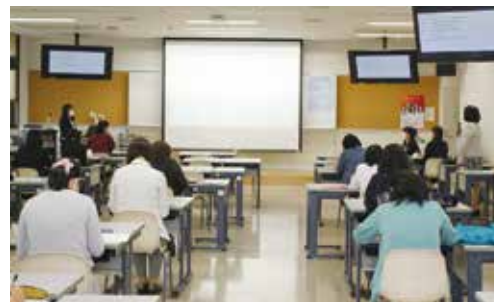
令和3年度 修士論文中間報告会

HANDsご愛読の皆様には、今後ともご支援ご協力を賜りますようお願い申し上げます。