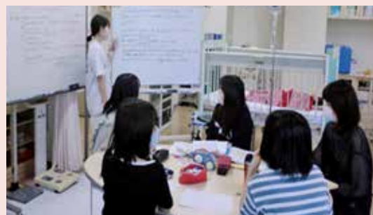
事例について、グループで話し合いをしています。

小児看護学実習では、肺炎の3歳児と家族への看護介入の検討とシミュレーション学習を行いました。グループで、発達課題や生理学・解剖学的観点から話し合うことで、自己課題の達成や思考の傾向に気付き、自己研鑽に繋がりました。