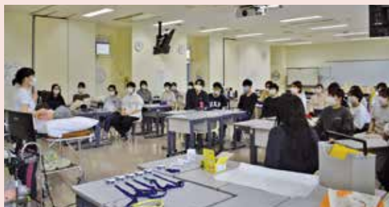
在宅看護学実習(フィジカルアセスメント)